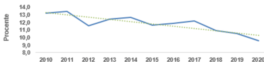
Figura 1. Cota agriculturii în volumul total al producției, 2010-2020,%, Biroul Național de Statistică

În aceste condiții, agriculturii i-au revenit în anul 2020 circa 9,6% din volumul total al producției, cu o reducere de circa 3,9 p.p. față de 2011 și cu o cotă medie pentru perioada de referință de circa 11,8%. Astfel, tendința generală a volumului producției agricole pentru perioada 2011-2020 a fost una negativă, cu o reducere medie anuală de circa 0,3 p.p. (figura 1).